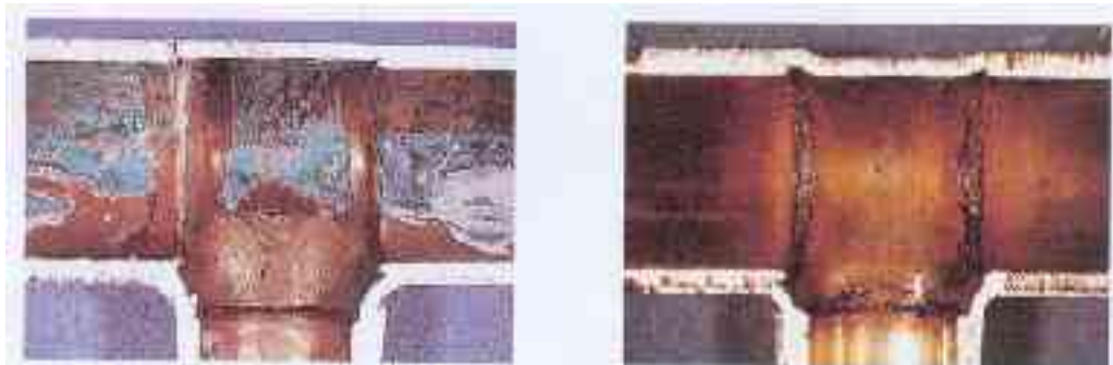
gelötet mit Flussmittel der alten Generation (zu hohes Metall- und Ammoniumchlorid) gelötet mit LAVAR-21 (F-SW21 / DIN 8511)

Von beiden Institutionen wurde LAVAR-21 das Gütezeichen verliehen. Weichlötlösungsmittel LAVAR-21 ist garantiert wasserlöslich. Ausführliche Untersuchungen haben erwiesen, dass bei fachgerechter Verarbeitung keine Korrosionen durch Flussmittelreste entstehen.