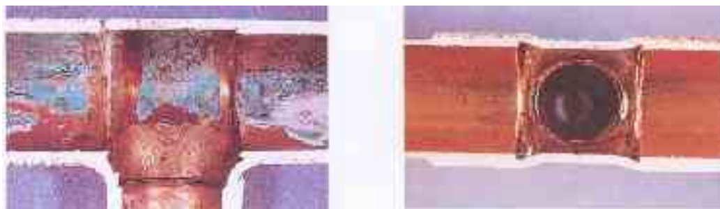
gelötet mit Flussmittel F-SW21 / DIN 8511 gelötet mit PARTUS-25 (F-SW25 / DIN 8511) Wirkstoffe Metall- und Ammoniumchlorid.

Ausführliche Untersuchungen haben erwiesen, dass bei fachgerechter Verarbeitung keine Korrosionen durch Flussmittelreste entstehen.